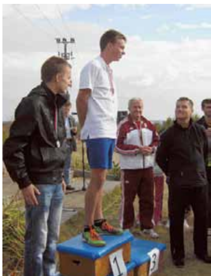
Itt mindenki nyertes

Hűen az elmúlt évek hagyományaihoz, idén is 1956 méter futottak a péceli tanulók, hogy kifejezzék hálájukat és tiszteletüket az ötvenhatos ifjúság, és mindazok iránt, akik mártírjai és megelői voltak az 1956-os forradalomnak és szabadságharcnak. 2003-ban, az isaszegi Szobor-hegyről rajtolt el első alkalommal az Októberi Emlékfutás az egyetemistákból alakult Magyar Keresztény Szövetség Egyesület és a Ráday Pál Gimnázium rendezésében, majd néhány évvel később a péceli Történelmi