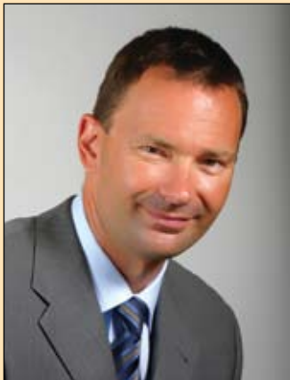
Gyenes Levente, polgármester