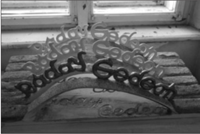
Ráday Gedeon tiszteletére

Ez évben VII. alkalommal nyitotta meg kapuit a Könyv-Tárgy Biennálé kortárs képző- és iparművészeti kiállítás a Ráday-kastélyban.