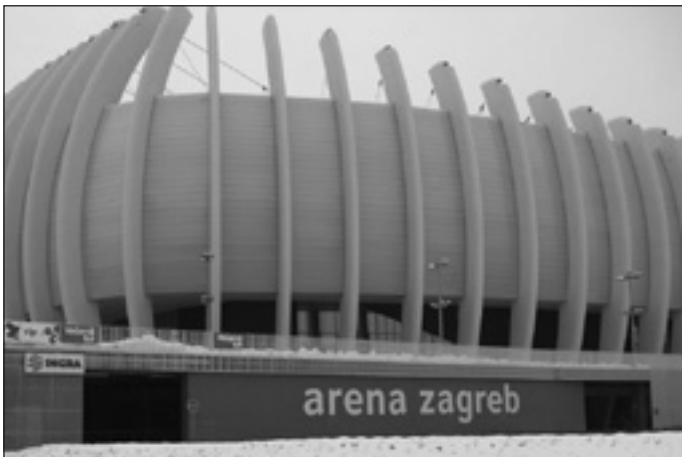
Az új Aréna Zágráb épülete

Placido Domingo hangjáért, az operáért lelkesedő társaságunk útjairól már többször beszámoltam, nem lehet meglepő, hogy ebben az évben földrajzi közelsége miatt ez a zágrábi koncert adta a legjobb lehetőséget számunkra, hogy idén is láthassuk, hallgathassuk kedvenc operaénekesünk hangját élőben. Tehát utaztunk Zágrába.