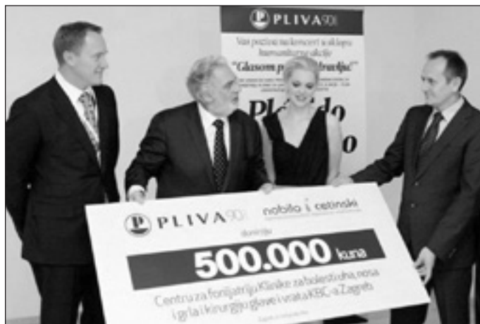
Domingo most is jótékonyági céllal énekel

Csodás este volt! Ennek az emlékéből megint egy ideig elédgelek, miközben lesem-várom, talán jövőre is láthatom, hallhatom Őt... ha esetleg nem itthon, akkor valamelyik szomszédos országban. Oda is elmennék, csak hallhassam Domingo hangját, láthassam azt a kedves mosolyt, ami akkor jelenik meg az arcán, mikor egy szép ária után a felcsattanó tapsot hallgatva köszöni szépen az ünneplést. Belefeledkezve hallgatni a számomra legszebb hangot, melyet csak két tenyerem végtelenített összeütésével tudok honorálni. Meggyőződésem, hogy én sokkal többet kapok minden alkalommal, amikor az Ő hangja vigasztal, felejteti a napi gondokat, mint amennyit az összerakosgatott forintjaim jelentenek a jegyaráért!