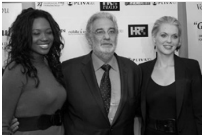
Angel Blue, Placido Domingo és Micaela Oeste

A koncertre Domingo partnereként Angel Blue és Micaela Oeste amerikai szopránénekesnőket, horvát vendégeként pedig a jelenleg legünnepeltebb popénekes, Tony Cetinskit hívta meg.