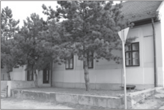
Az OTP volt épülete

Múzeumi gyűjtés és kiállítás szempontjából Pécel a váci Tragor Ignác Tájézmúzeum szakmai és felügyeleti hatáskörébe tartozik. Az intézmény igazgatója minden szükséges szakmai és szervezési segítséget megígért és ennek érdekében rövidesen felkeresi a Polgármesteri Hivatalt.