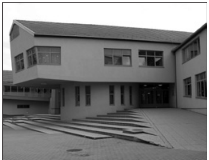
A POK Kossuth téri épülete

– A Szemerében az ötödik osztályokat összevontuk, viszont a 3 nyolcadik osztályt – annak érdekében, hogy tanítványaink