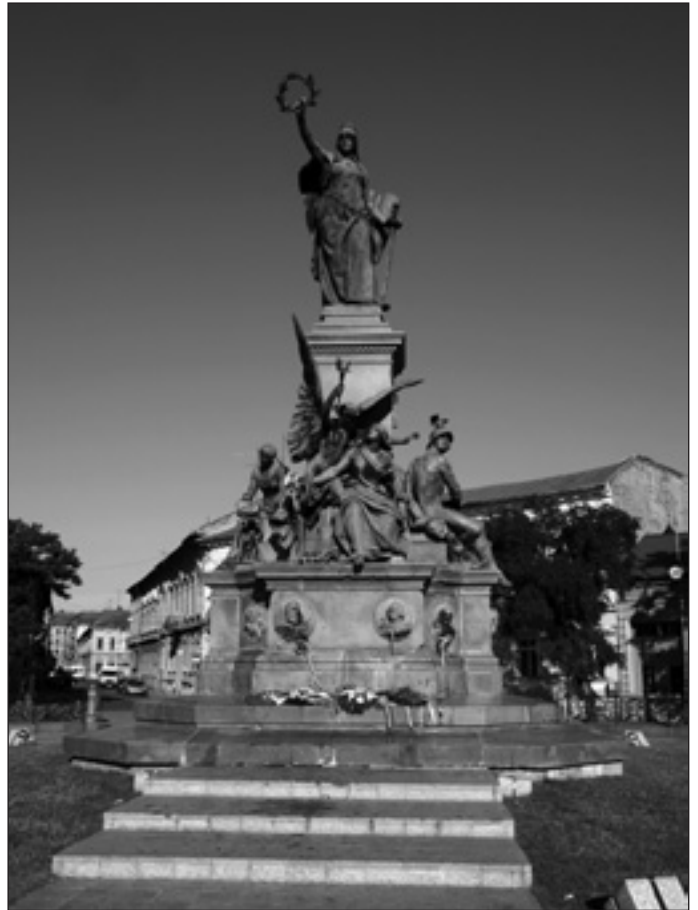
Vértanúk szobra, Arad

E KATONÁK SOKBAN KÜLÖNBÖZTEK: néhányan forradalmárnak vallották magukat, mások csak esküjükhöz kívántak hűek maradni. A magyarokon kívül volt közöttük német, osztrák, lengyel, horvát, szerb; kisnemes, polgár és főnemes; dúsgazdag és vagyontalan; voltak közöttük barátok és ellenfelek, de egyben azonosak voltak: hősiesen harcoltak a magyar szabadságért, nemzeti függetlenségünkért, s életüket áldozták.