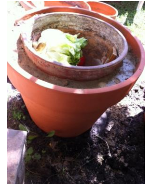
Az alakulóban lévő Zeer-edény