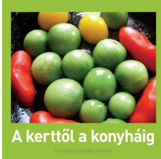
A kerttől a konyháig

Főzési rutinunk alaposan átalakult az elmúlt néhány évtizedben. Autóba be, a legközelebbi hiperszupermarketnél ki, bevásárlókocsi telepakol, és már főzünk is. Már ha egyáltalán főzünk, és nem eleve kész, vagy félkész árut vásárolunk.