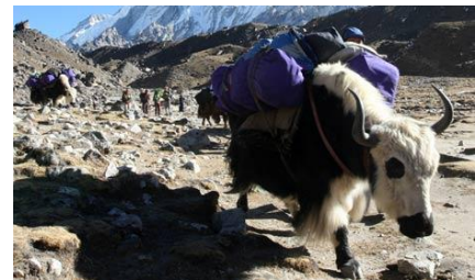
Yakok cipelik a felszerelést a Himalájában.

Lukla repterét hegyek övezik, csak kis repülőket fogad és ha felhős az ég, nincs légiforgalom - így nehéz tervezni a kutatóutakat és támogatásokat, mert a költségek is nehezen tervezhetők. A kutatáshoz szükséges felszerelést állatok vagy emberek szállítják a célállomásra, ahogy a gleccsertavak kutatásához nélkülözhetetlen csónakot is – 5000m-re felcipelgetni egy csónakot viszont további jelentős kiadás.