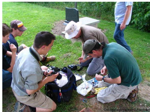
Önkéntesek munka közben Kép forrása: www.gyongybagoly.hu

Forrás: http://www.greenfo.hu/programok/2011/09/19/angliai-termeszetvedelmi-osztondij-2011-2013