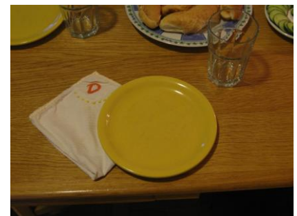
Teríték textil szalvétával: sokszor felhasználható, és a mosás lábnyoma meg sem közelíti a papír gyártását...